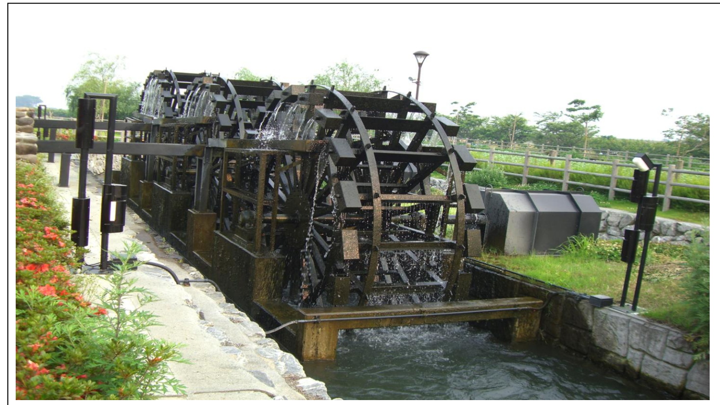
三連水車