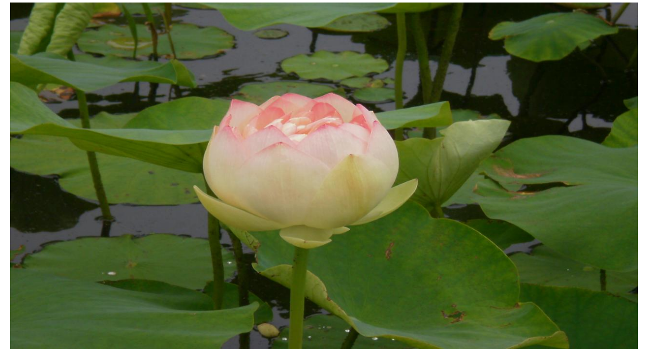
千町無田水田公園

グループホーム ソレイユ 福岡市南区老司 1-1-11 ☎092(565)8436 FAX092(565)8437